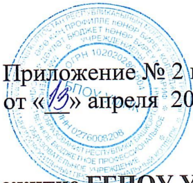
График заселения обучающихся в общежитие ГБНОУ УМПК на 2023-2024 учебный год

Приложение № 2 к приказу от «13» апреля 2023 г. № 109